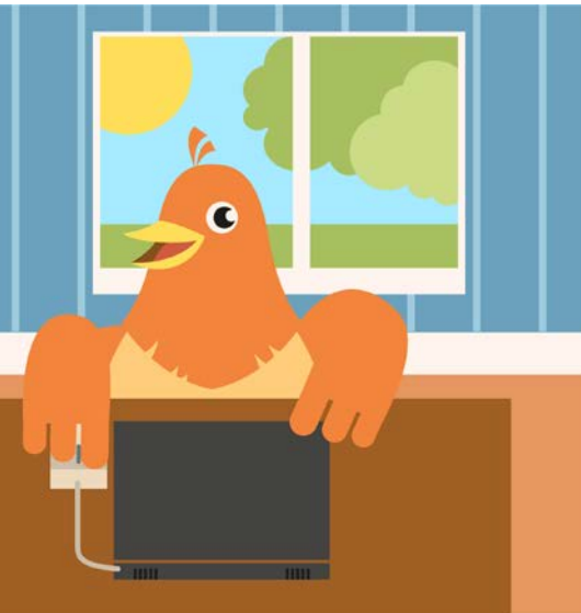
Abbildung 1: Chronotypen – Die „Lerchen“ sind Morgenmenschen, während die „Eulen“ Abend-/Nachtmenschen sind.

Unabhängig von äußeren Einflüssen sind manche Menschen eher „Lerchen“ (Morgenmenschen), andere eher „Eulen“ (Abend-/Nachtmenschen). Nur bei extremen Ausprägungen dieses sogenannten „Chronotyps“ (z. B. wenn die Erfüllung der für Ausbildung oder Arbeitsumfeld notwendigen Anforderungen unmöglich wird) ist eine Abklärung und Behandlung notwendig.