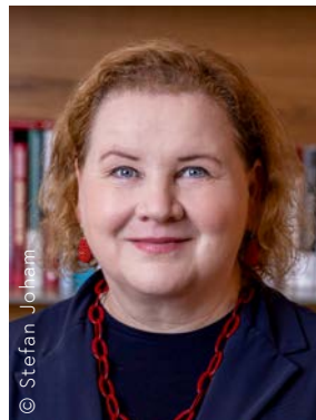
Bundesministerin Korinna Schumann

Diese Broschüre soll Sie dazu anregen, sich bewusst mit dem Thema Schlaf auseinanderzusetzen. Sie bietet praxisnahe Informationen zu den unterschiedlichsten Formen von Schlafstörungen und zeigt, wie diese gezielt behandelt werden können. Ziel ist es, das Bewusstsein für die Bedeutung eines guten Schlafs für die Gesundheit zu stärken und Ihnen gleichzeitig Wege aufzuzeigen, wie Sie Ihre Schlafqualität verbessern können. Falls Sie