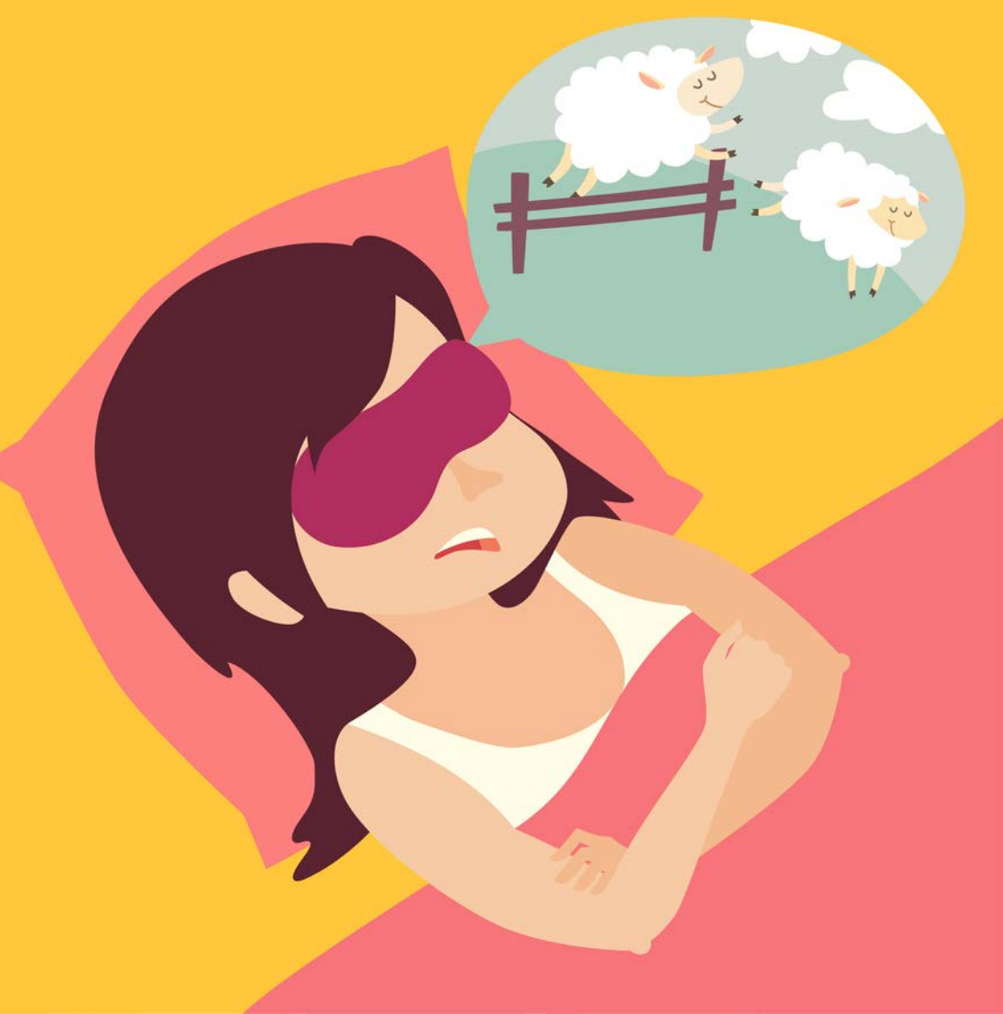
Abbildung 2: Schäfchen-Zählen Schäfchen-Zählen, eine oft beschriebene Einschlafstrategie bei Insomnie.