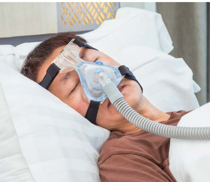
Abbildung 4: Obstruktive Schlafapnoe

Bei speziellen Formen (z.B. lageabhängigen schlafbezogenen Atemstörungen) ist auch ein Vermeiden der Rückenlage schon sehr hilfreich. Zusätzlich ist immer ein Anstreben des Normalgewichtes sinnvoll. Der Einsatz alternativer Therapieoptionen (Bisschiene, chirurgische Eingriffe) erfordert immer zusätz-